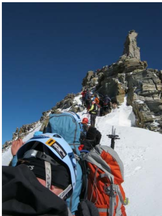
Очередь к вершине!