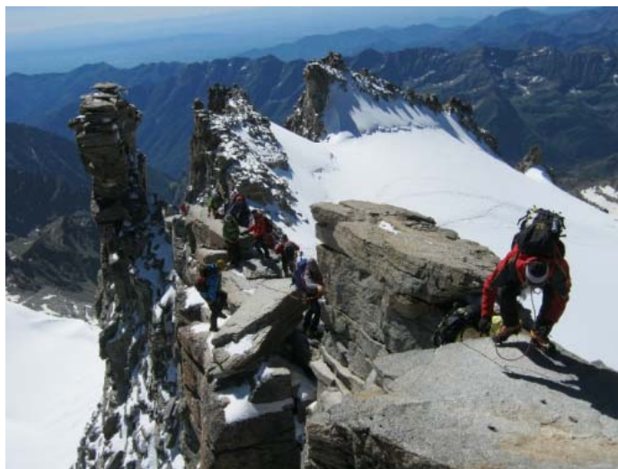
Еще несколько шагов - и вершина!