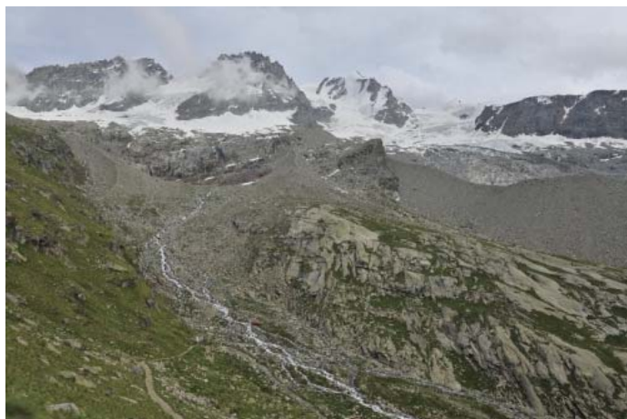
Petit Paradiso и Grand Paradiso