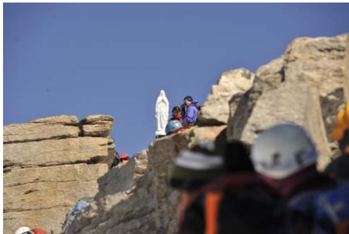
Вот она - Мадонна!