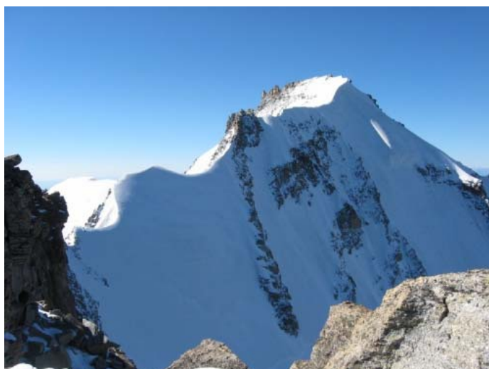
Белоснежный Grand Paradiso