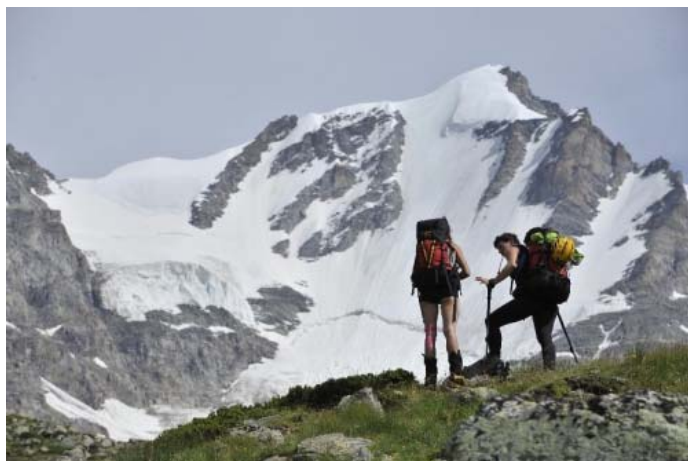
Многое еще нужно обсудить перед восхождением