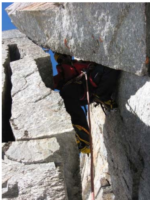
Преодоление обледенелого камня