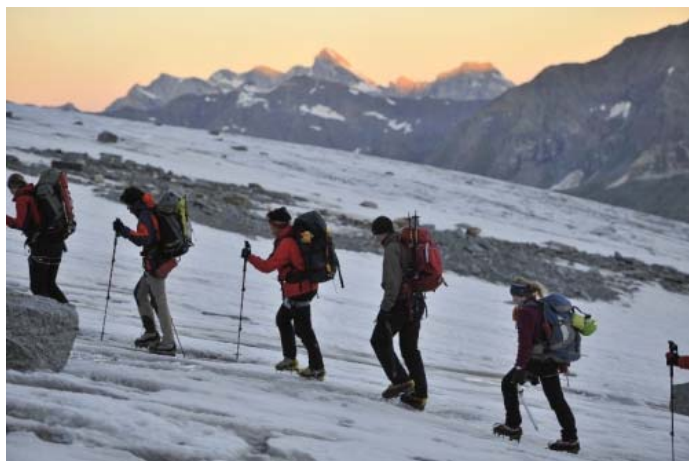
Начало подъема на Grand Paradiso по "Классике"