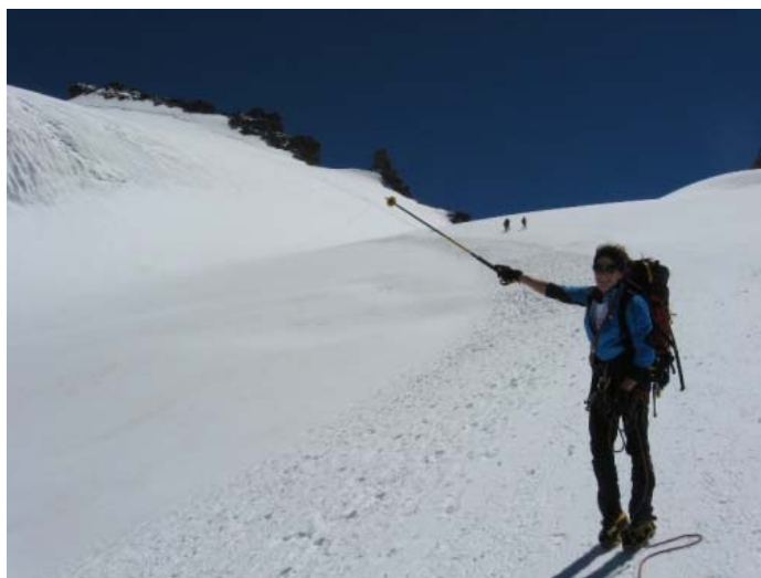
Мы спустились вон от туда!