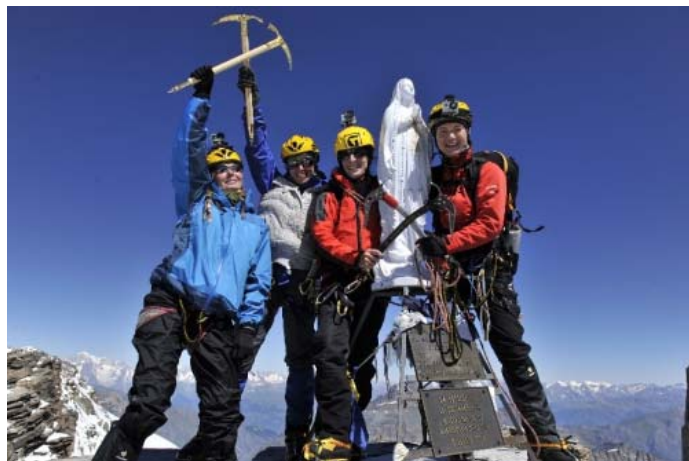
Еще немного фото к статье "Из Малого Рая в Большой", опубликованной в журнале Риск Онсайт №64 2013