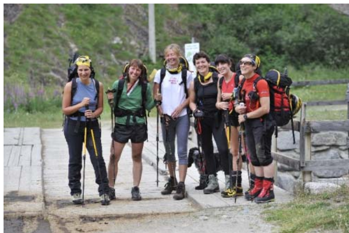
Перед подъемом на хижину Шабо