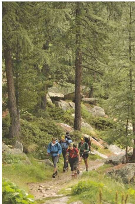
Вначале тропа идет через хвойный лес