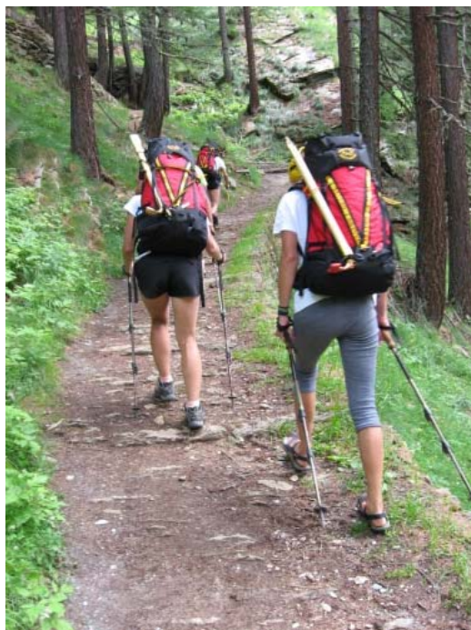
Девочки пошли на восхождение с настоящими золотыми ледорубами!