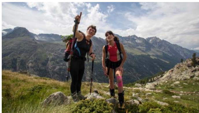
Завтра нам - вон туда!