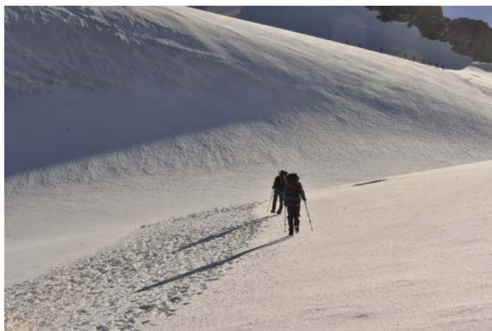
В снегах Grand Paradiso

У Оли Городецкой всегда отличное настроение! :)