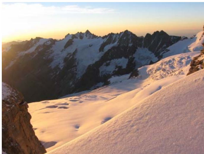
Раннее утро на склонах Petit Paradiso