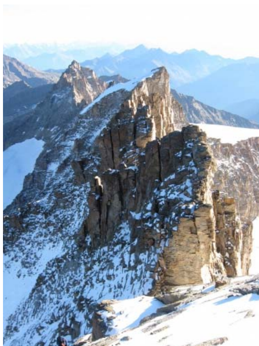
Бесконечный гребень Petit Paradiso