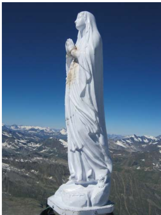
Мадонна Снегов на вершине Grand Paradiso