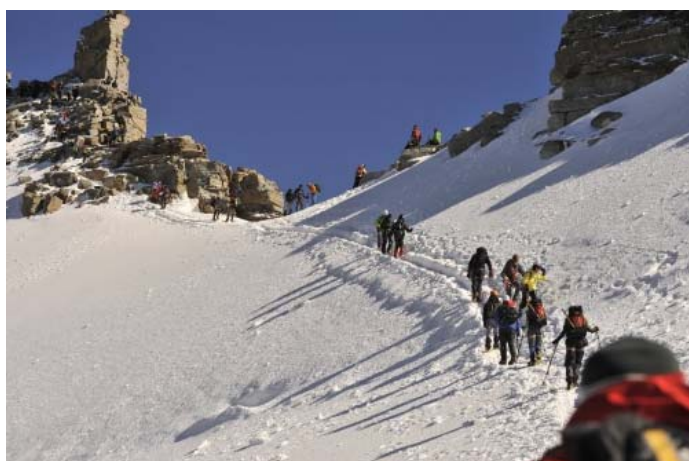
Вершина уже рядом