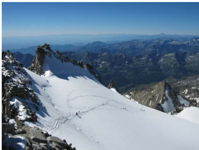
Путь спуска по "Классике"