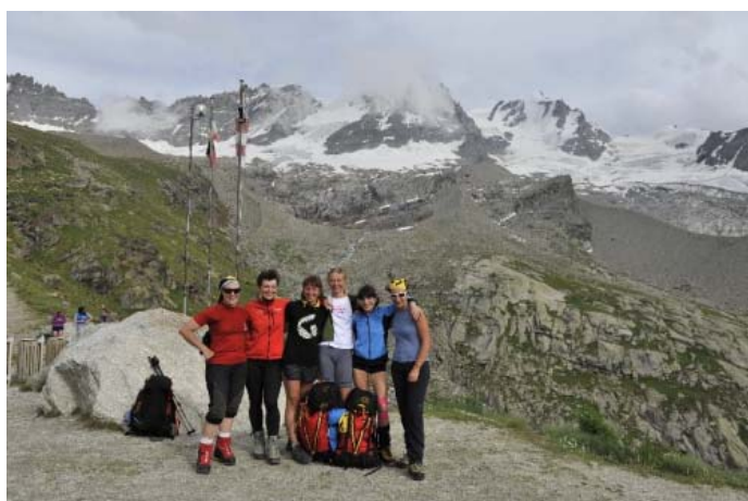
На приюте Шабо