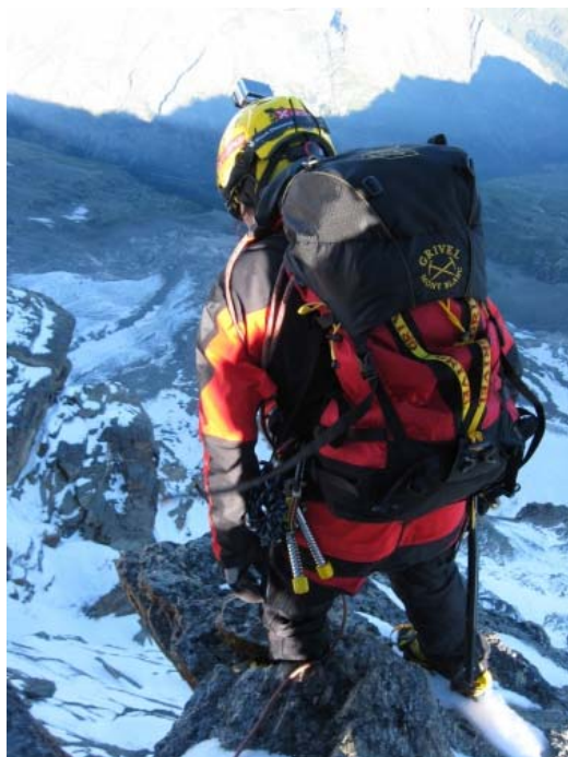
На траверсе Petit Paradiso и Grand Paradiso