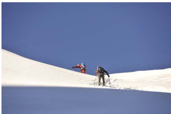
Между небом и землей