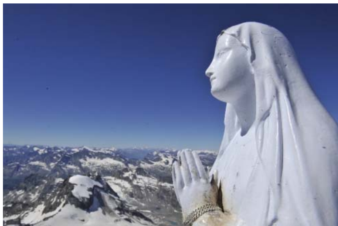
До свидания, Мадонна!