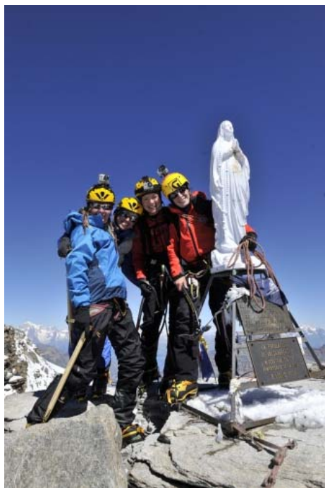
На вершине Grand Paradiso