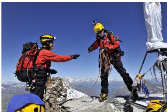
Этот камалот на спуске не нужен